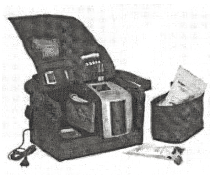
Рис. 1. Тест-комплект Drager DrugTest 5000.

Лідером у розробці та виробництві техніки для встановлення в організмі людини наркотичних засобів і психотропних речовин саме за слиною є німецька фірма "Drager". Прилади під цією маркою належать до категорії професійних аналізаторів, призначених для одночасного виявлення у рідині ротової порожнини (слині) людини наркотичних засобів та психотропних речовин таких груп: опіати, канабіноїди, кокаїн, амфетамін, метамфетамін, бензодіазепіни з метою якісної діагностики ( in vitro ). Виявлення та ідентифікація наведених вище речовин здійснюється за допомогою тест-комплекту Drager DrugTest 5000 (див. рис. 1) [5].